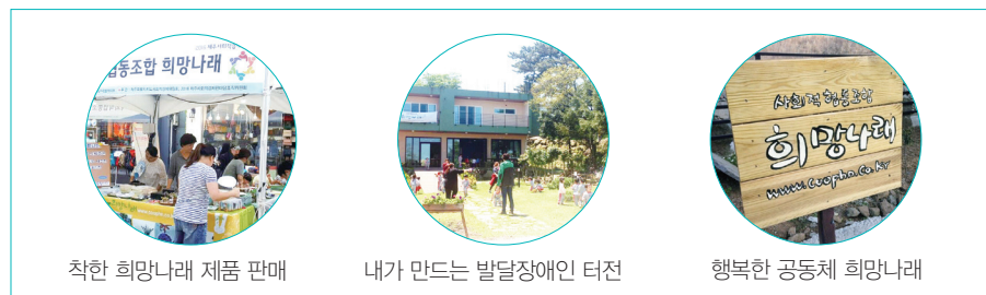
착한 희망나래 제품 판매

인쇄 및 판촉물 사업 확대를 통해 장애인 의 후가공 참여 일자리를 늘리는 한편, 지역 내에 직접생산이 되지 않는 쇼핑백 제작으로 사업영역을 확대할 계획을 가지고 있다. 또한 5년 후에는 총매출을 10억으로 높이겠다는 다짐과 함께 주간보호시설 노후유를 살려 발달장애인 사회적주택 운영 확대 등 다양한 사회서비스 사업을 진행하고자 한다. 희망나래는 ‘발달장애인의 사회서비스와 일자리 창출’의 뜻을 가진 사람들이, 함께 힘을 모아 행복한 세상을 꿈꾸는 조합이다. 희망나래를 이끌어가는 모든 조합원을 통해 우리사회가 좀 더 따뜻한 곳으로 변화될 것이기 때문이다.